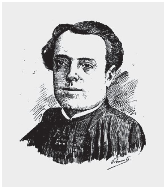
Fig. 1 18

En cualquier caso, en las primeras décadas del XX —según los datos que figuran en la estadística de colegios y escuelas públicas y privadas encargadas de la educación de ciegos y sordomudos— el panorama no había cambiado. En Galicia, en el año 1925, había solamente dos instituciones que hacían frente a la enseñanza de estos alumnos, las mismas que las inauguradas en el siglo anterior: el Colegio regional de sordomudos y ciegos de Santiago de Compostela y la Escuela de ciegos y niños pobres del Campo de la leña, que, por entonces, contaba con 12 alumnos externos y dependía del Patronato de las Escuelas Populares Gratuitas 17 .