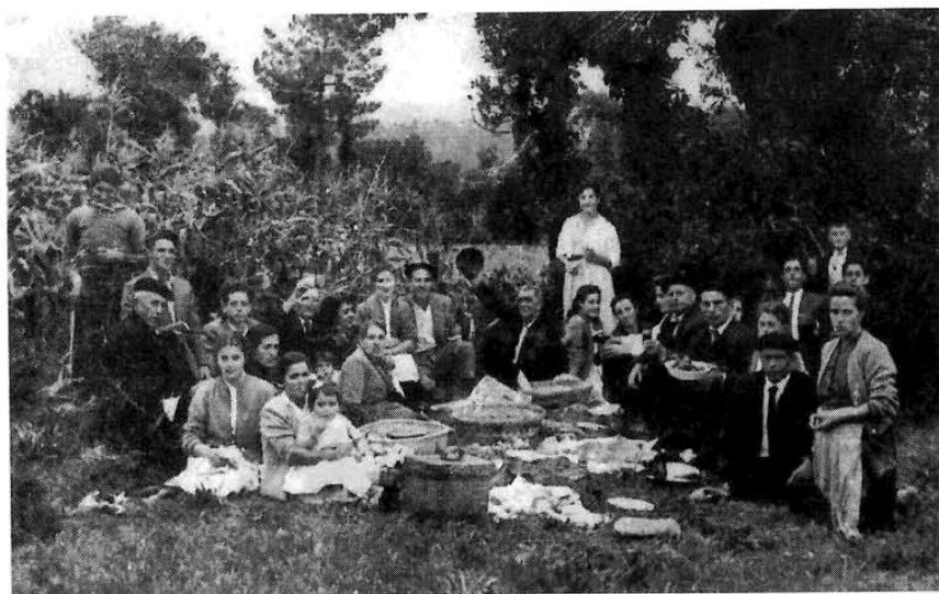
Comida familiar na romaría da Santiña de Trasufre. finais dos anos cincuenta.