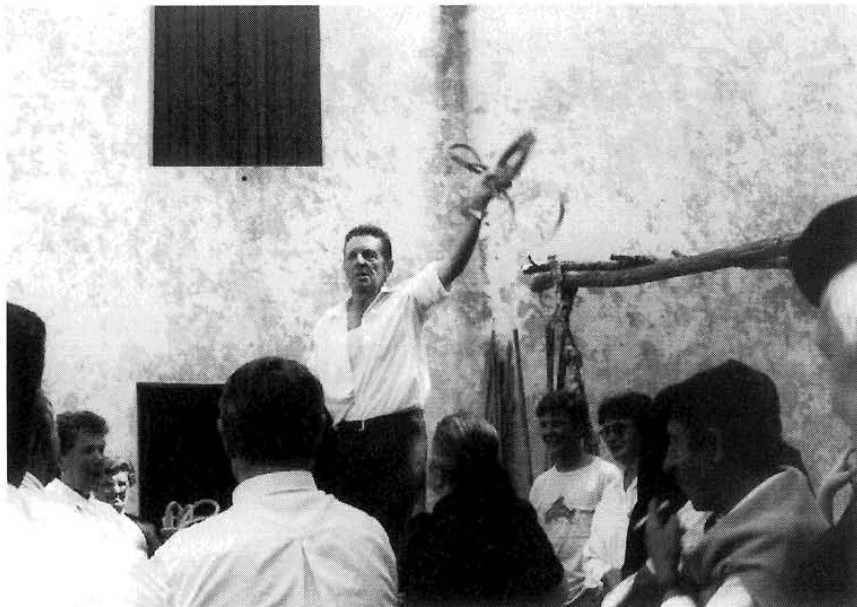
A poxa dos rellos na romaría de Sta. Mariña.