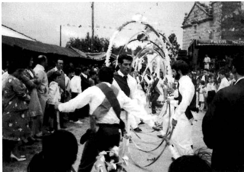
A danza dos arcos de Coucieiro a principios dos oitenta.

Os danzantes, mozos da parroquia, vestidos de branco e cunha cinta azul cruzándolle o peito, agás os dous mestres que levarán pantalón de tergal e dúas cintas, e en número par, esperan a saída da procesión na porta da igrexa 1 . Cando esta vai saír erguen os arcos e pasan por debaixo deles