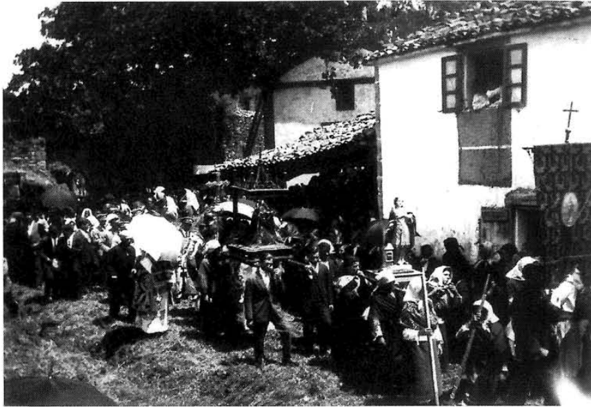
Procesión en Sta. Mariña, anos 40.