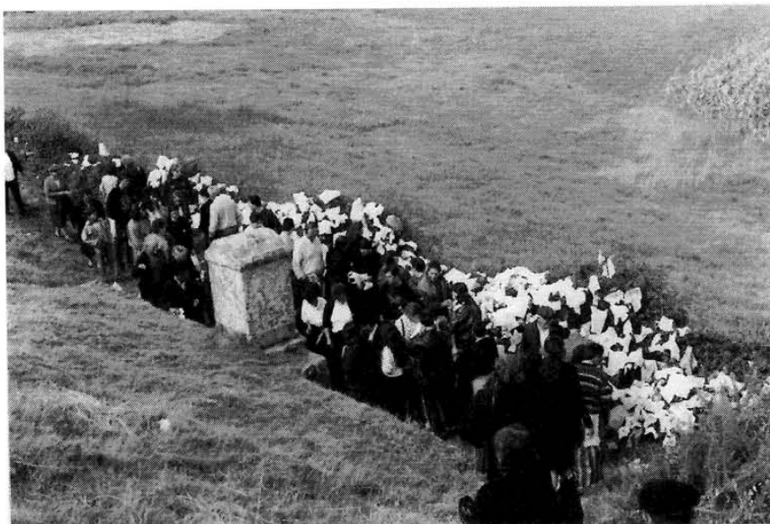
A fonte da Santa, en Trasufre, e os panos que os devotos van deixando pola silveira.