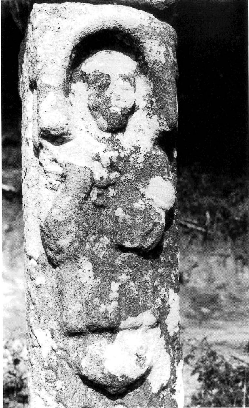
Lám. XII. Cruceiro da Goriña: San Pedro.