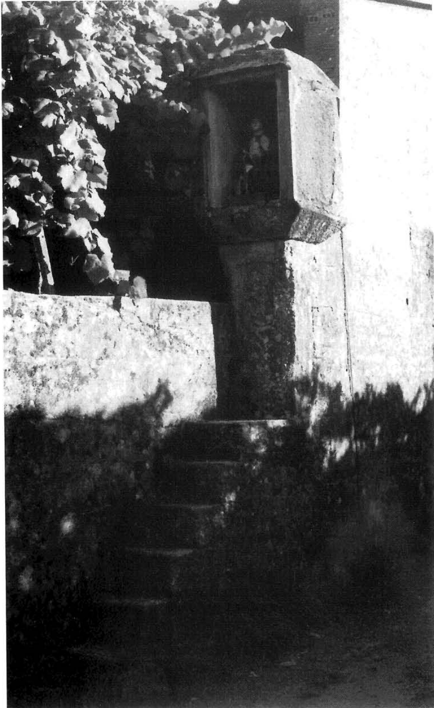
Lám. IV. Cruceiro do Quinteiro.