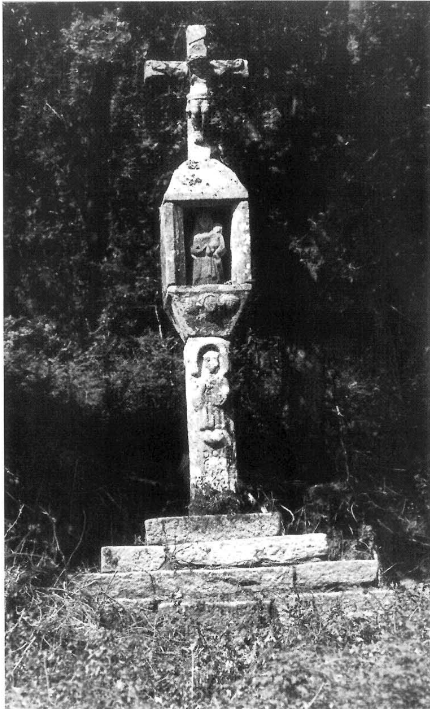
Lám. XI. Cruceiro da Goriña.