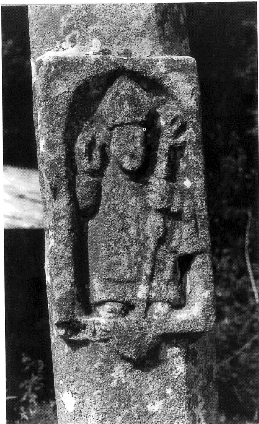
Lám. VII. Cruceiro do Saramagal: San Martiño ou San Brais.