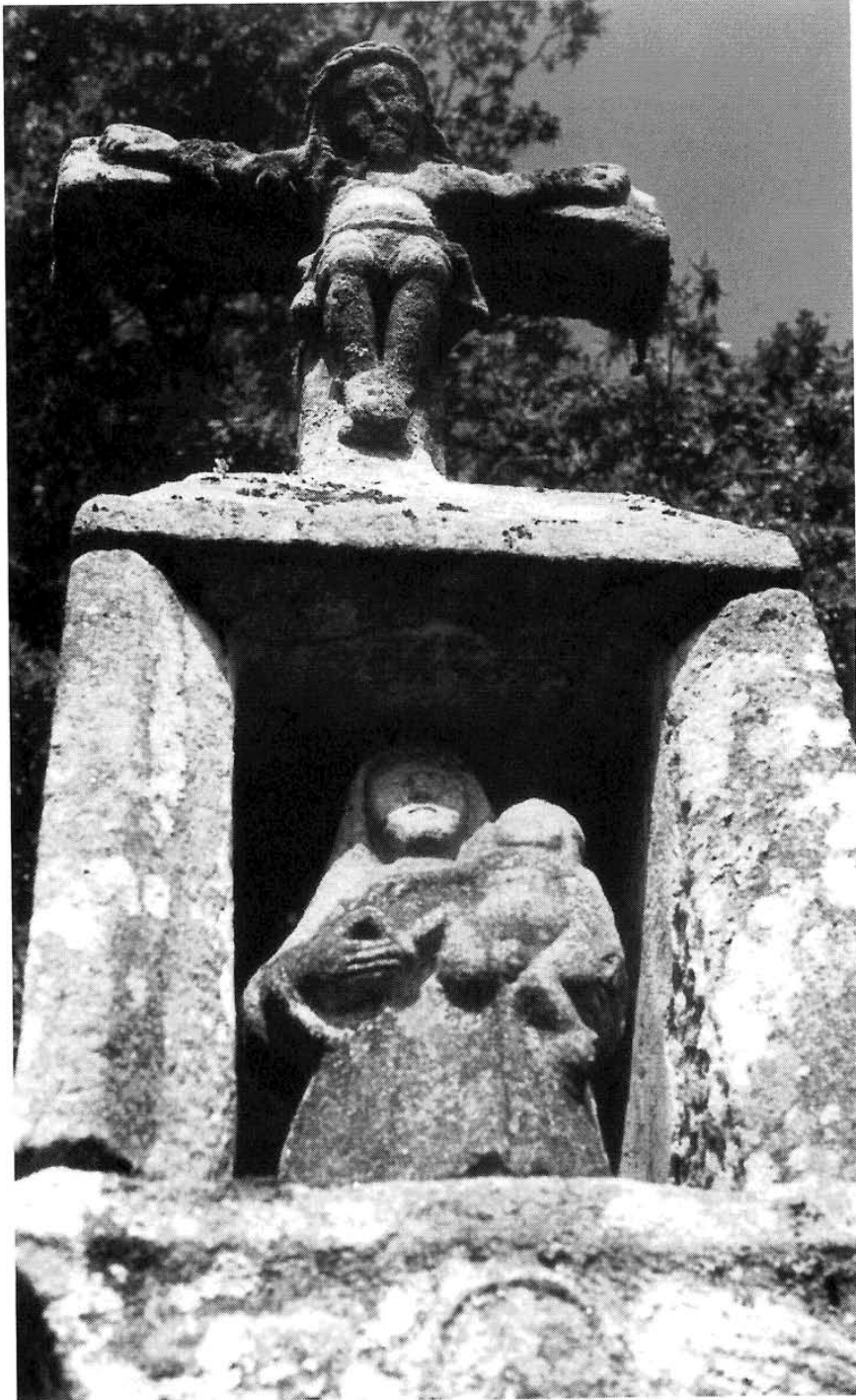
Lám. XIII. Cruceiro da Goriña: capela e Cristo.