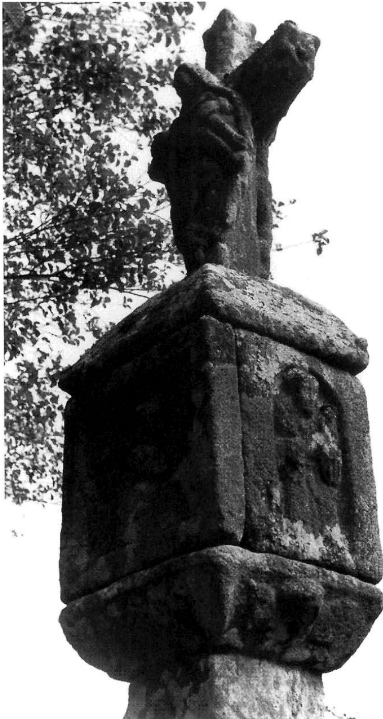
Lám. IX. Cruceiro de Saramagal: Santo Antonio, a Virxe das Angustias e San Diego de Alcalá (?).