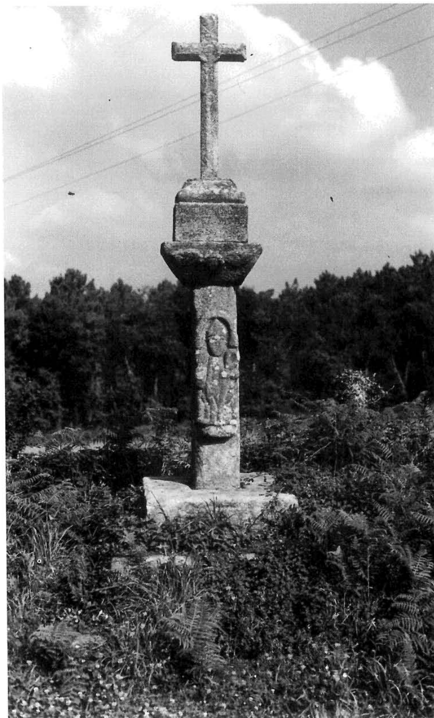
Lám. II. Cruceiro da Amañecida.