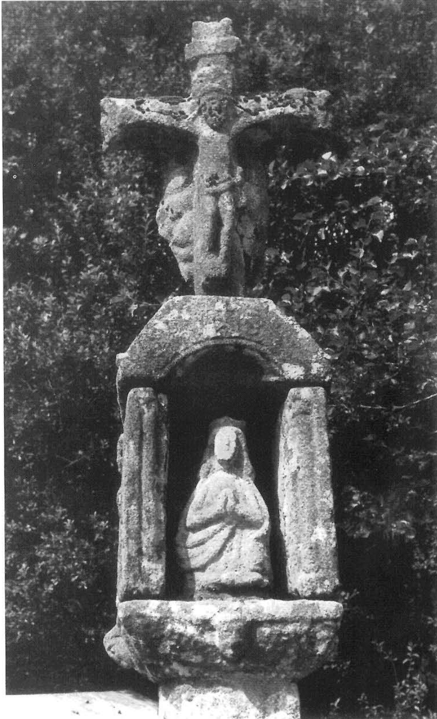
Lám. X. Cruceiro do Saramagal.