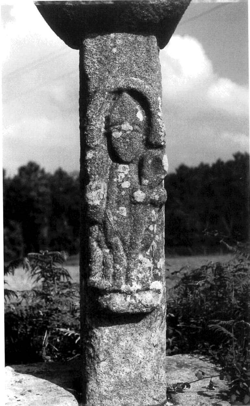
Lám. III. Cruceiro da Amañecida: San Martiño ou San Brais.