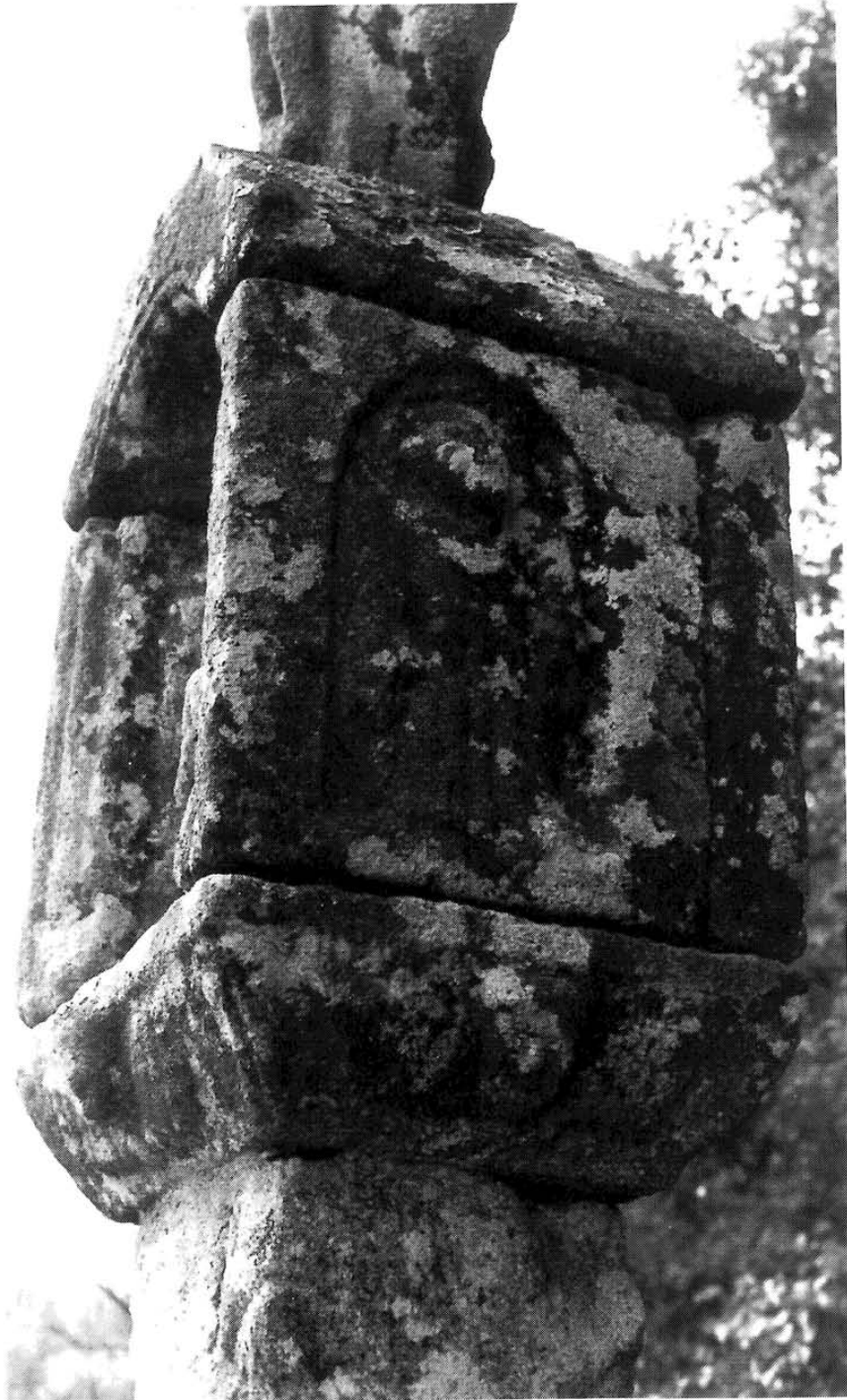
Lám. VIII. Cruceiro do Saramagal: San Francisco.