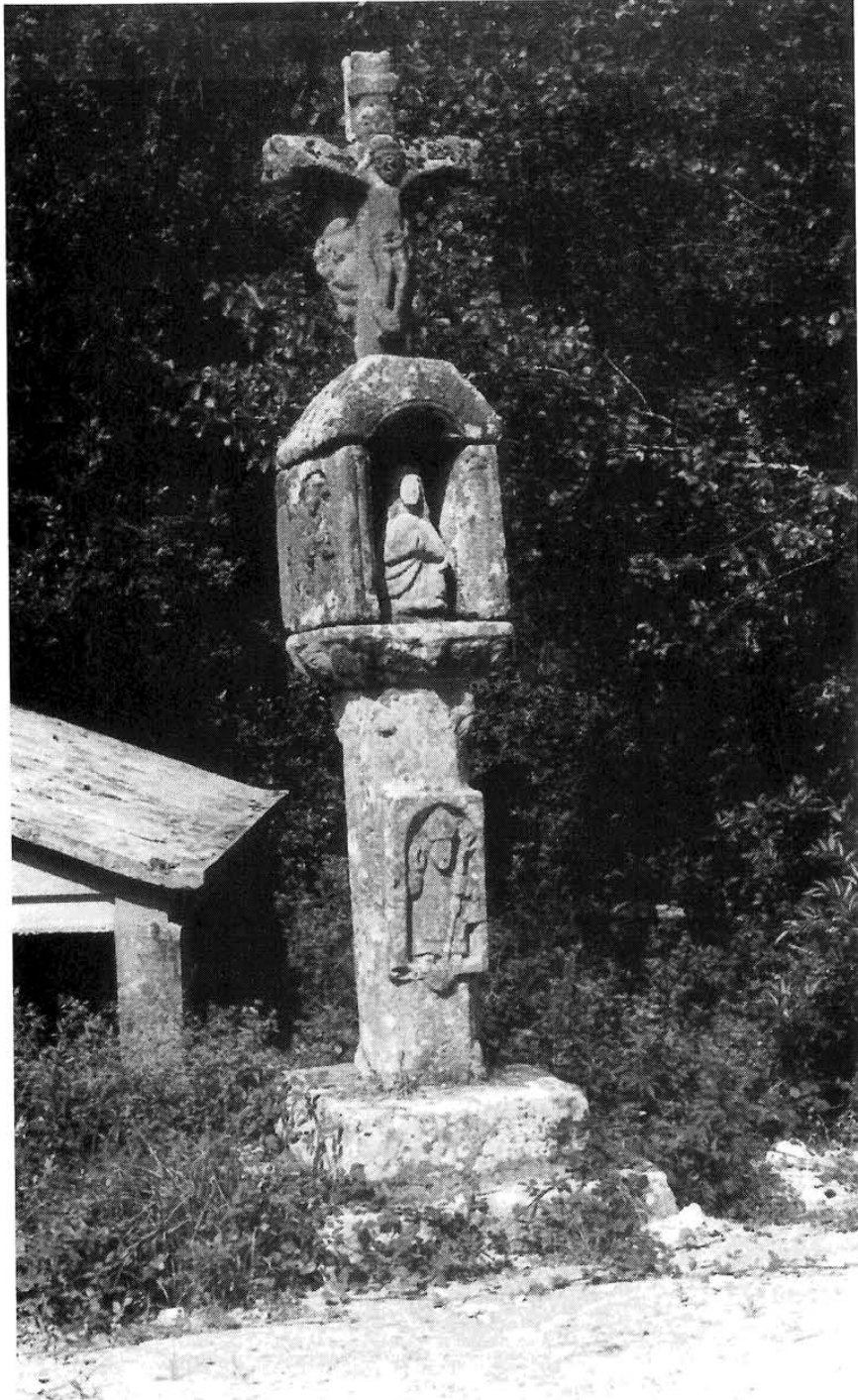
Lám. VI. Cruceiro do Saramagal.