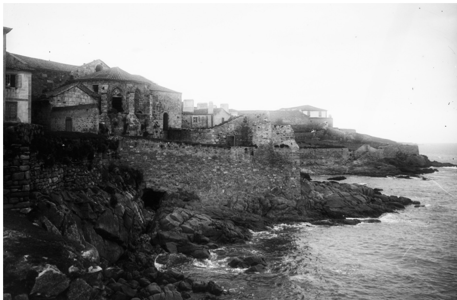
Fig. 6. El convento de San Francisco de A Coruña en su ubicación original.

En la parte occidental del templo un pequeño atrio se situaba ante su portada con el mismo pavimento de guijarros que el claustro, tal como han puesto en evidencia las excavaciones realizadas en los primeros años del 2007 en las dependencias del Museo Militar, y que en la actualidad pueden contemplarse en el interior de dicha institución.