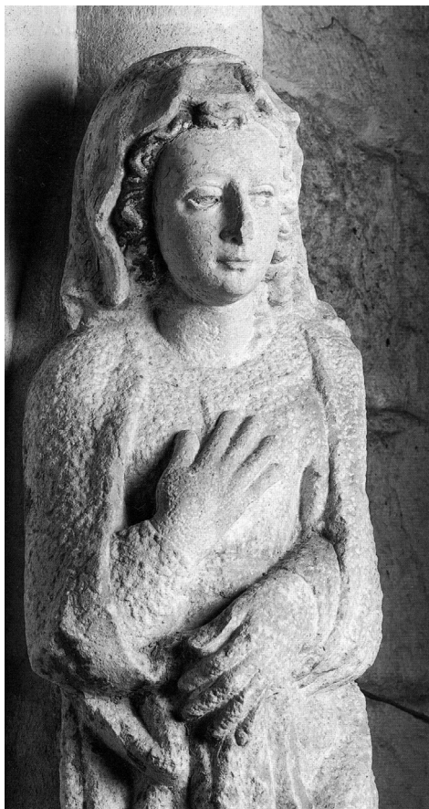
Fig. 5. Detalle Virgen de la Anunciación. Colegiata de Santa María del Campo.

...desde el primero del mes de henero del año de mill y seisçientos y veinte y tres hasta el mes de mayo del dicho ano se hizo y fendio la campana mayor desta yglesia colegial y bino a esta çiudad un fundidor llamado Juan de Munar el qual se conserto con el prior y cabildo desta colegial de fundilla en precio de mill maravedis a toda costa y poniendo todo el desgajo del metal que fuese nessessario y se pesso la qual pesso nueve quintales menos cinquenta lubras el dicho fundidor la fundio en la cassa de la moneda a siete dias del mes de mayo del dicho año quitaron la de avajo de la tierra a ocho y a nueve la llevaron a pessar a la casa de la hartilleria y a honze la llevaron a la dicha yglesia y pusieronla junto a la capilla de nuestra señora del portal para subirla a la torre y en la dicha torre estaban los fundidores