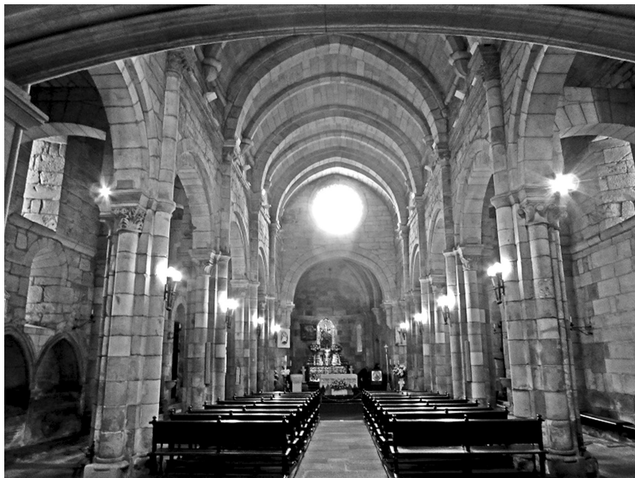
Fig. 3. Interior de la Colegiata de Santa María del Campo.

que cantaren as misas que por mina anima e de meus antecesores se ende diseren e que fazan pintar todo endarredor do dito altar de santa maría a estoria da pasion de nuestro senor Ihesu Christo e enbaixo de todo minas armas con dous angeles endearredor e nelas con o letreiro que dize “o mater dei mememto mei” y encima do escudo das armas que diga “ihu” ... 52 .