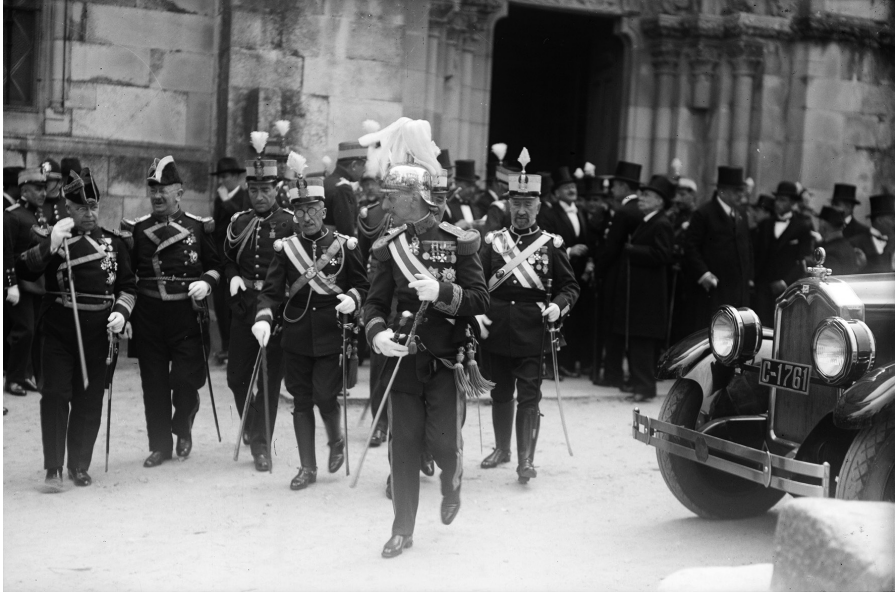
Fig. 4. Autoridades militares saliendo de La Colegiata de Santa María. 192-?

Así pues, se constata documental y materialmente la importante reforma realizada en época gótica en el templo de Santa María presente en la actualidad a través del rosetón que se abre sobre su cabecera, la torre norte, algunos de sus capiteles, motivos decorativos y el replanteamiento que muestra su cubierta.