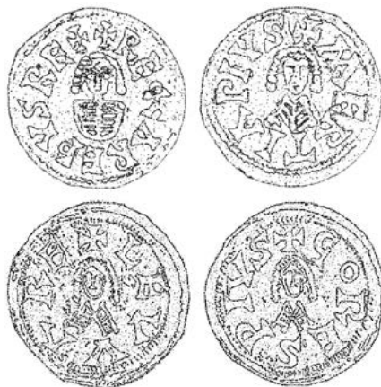
Figura 4. Exemplos de numerario galaico-visigodo. Imaxe superior: cuñaxe de Recaredo (586-601) en Merza. Anverso: + RECCAREPVS RE +; reverso: + MERTIA PIVS. Imaxe inferior: cuñaxe de Liuva (601-603) en Valdeorras. Anverso: + LEVVA RE; reverso: + GORES PIVS. Elaboración propia en base ás fotografías de PLIEGO VÁZQUEZ, “Gallaecia...”, páxs. 82 e 84. Nótese, nomeadamente, a explícita referencia rexia destes exemplares, que os afasta da serie Latina (cfr. Fig. 3).

Porén, válidas ou non, o certo é que as esporádicas noticias en cuestión, pola súa xenericidade, teñen pouco que aportar arredor da sorte das remanentes estruturas municipais da Gallaecia tardo-antiga en concreto. O único testemuño específico, no marco xeográfico do reino suevo e da amplificada Gallaecia visigoda temperá, concretamente na contorna da lusitana Idanha, atopámolo nunha comunidade consignada no Parroquial suevo como Municipio e no numerario visigodo como MONECIPIO (Fig. 1) 85 . Xa o padre P. David se preguntou lexitimamente