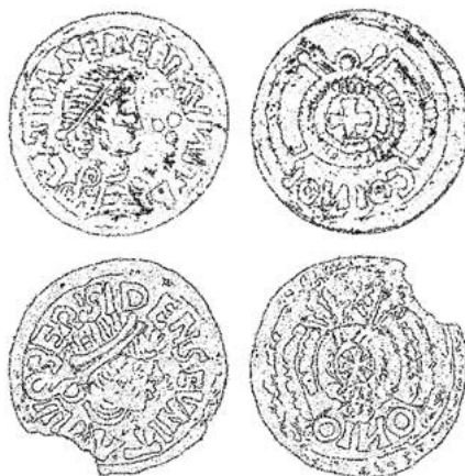
Figura 3. Exemplares da serie Latina . Imaxe superior: emisión emeritense. Anverso: LATINA EMERI MVNITA; reverso: COINOI (retrógrado). Imaxe inferior: emisión da ceca Berese . Anverso: BERISIDENSCVNITA; reverso: ONIO (retrógrado). Elaboración propia en base ás fotografías de GONZÁLEZ GARCÍA e MARTÍNEZ CHICO, “Hallazgo...”, pág. 226, e CABRAL e METCALF, A moeda... , pág. 305, reproducida por MARTÍN VISO, “Circuits of Power...”, pág. 224. Nótese, nomeadamente, a elusión de toda referencia rexia en ambas as moedas, amais da súa afinidade iconográfica, que xustifica a inclusión da inferior, malia a súa carencia da definitoria fórmula Latina , na mesma serie monetar.

Nestas circunstancias, albíscanse motivos máis ca razoábeis para dubidarmos da idoneidade desta hipótese. En primeiro lugar, a suposta énfase nunha “latinidade” cultural podería lerse dende unha perspectiva xustamente contraria: no canto dunha mensaxe integradora da monarquía xermánica, ausente nestas moedas, unha afirmación identitaria e mesmo excluínte do corpo social latino maioritario. Segundo algúns estudosos, a serie Latina certificaría a plena autonomía das comunidades emisoras, representadas nin máis nin menos que polos descen-