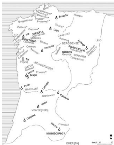
Figura 1. Mapa de referencia. A liña exterior delimita, dun xeito meramente aproximativo, a Gallaecia lato sensu na súa extensión sueva e visigoda temperá; a Gallaecia stricto sensu —en exclusión dos ámbitos asturicense e lusitano—, nos seus confins tardo-visigodos, é delimitada pola liña interior. Sigo aquí a miña mesma cartografía reproducida en FERNÁNDEZ CALO, Estado... , páxs. 249, 297 e 318.

Salientadas con cruces, sés episcopais deste período. En gris e en minúscula, igrejas étnicas e comunidades afíns aludidas no texto: deliberadamente, inclúense só as máis claramente asociábeis a esta categoría, co gallo de perfeccionarmos o contributo visual do mapa.