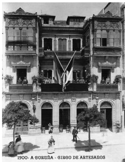
Fig. 2. Circo de Artesanos de A Coruña.