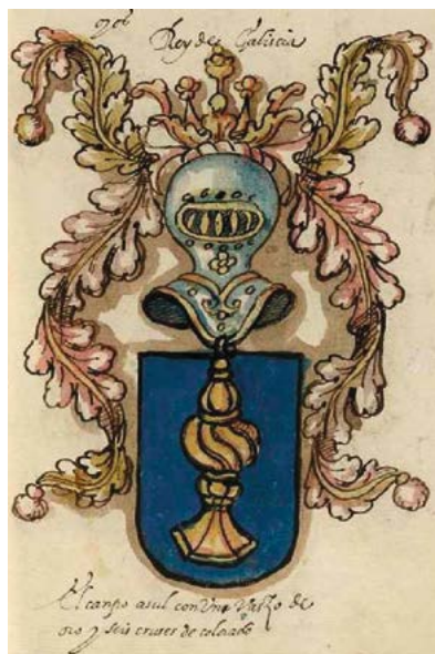
Fig. 1. BNE, Ms 1196: Libro de armas y blasones de diversos linajes y retratos [entre 1500-1600].