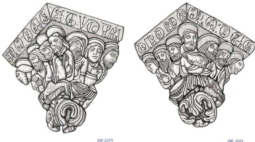
Figs. 4 y 5. Debuxos arqueolóxicos do capitel pinxante da Catedral de Lugo, autoría de Estefanía Moreno Porcal (IEGPS-CSIC-XuGa).

Muchos siglos antes que la sanctidad de Urbano IV, año 1264, señalase día especial con octava en toda la Christiandad, para que se tributasen a Christo Sacramentado manifesto y sin velo, festivos y solemnes cultos, sacándole en público por las iglesias y calles, ia en esta iglesia de Sancta María de Lugo estava continuamente patente y a todas horas en continuo octuario del Corpus le gozava, renovándole todos los jueves... (páx. 293).