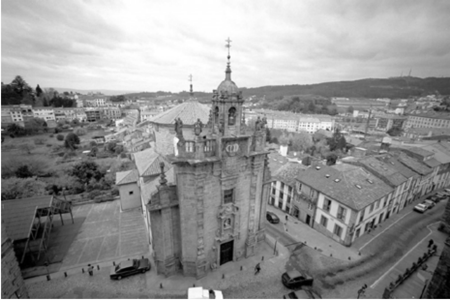
Fig. 4. Estado das rúas da Trindade, Hortas e Carretas antes da actuación.