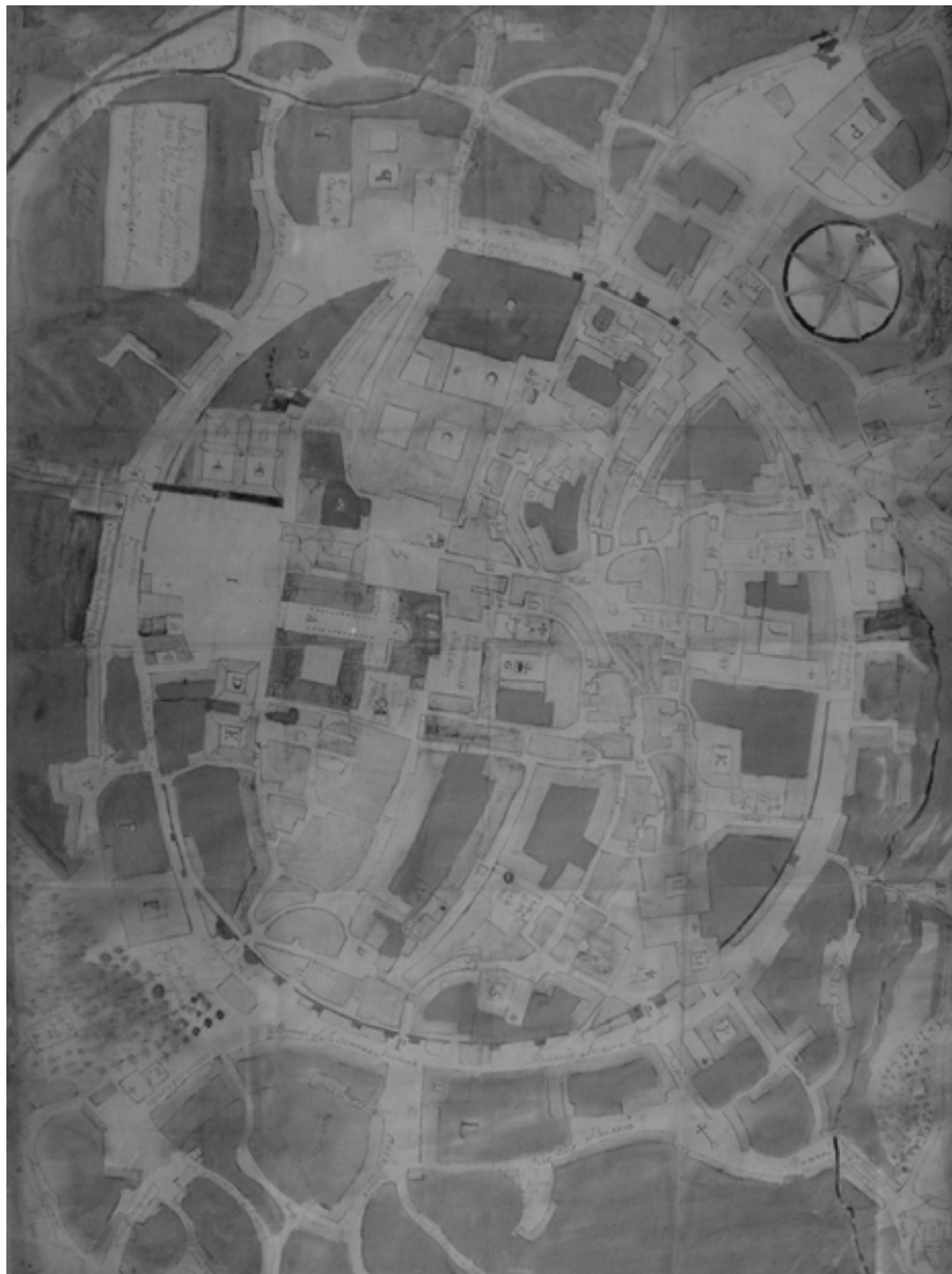
Fig. 2. Plano de Santiago de Compostela, mediados do século XVIII. Francisco Ferreiro. Instituto de Estudos Galegos Padre Sarmiento, CSIC.