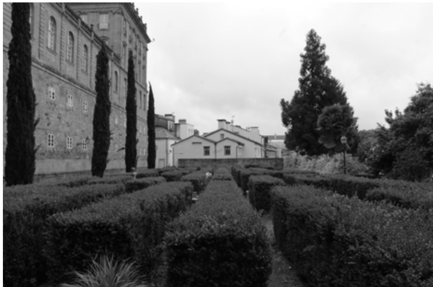
Fig. 6. Xardín de San Froitoso, xullo de 2021. (Imaxe dos autores).

É un labirinto que non oculta, senón que guía, que invita ao espectador a seguir o seu camiño dende unha perspectiva superior, a facer a súa propia peregrinación. Recorda a viaxe iniciática á que se sometían todos os peregrinos que aí descansaron, aos obstáculos e penurias que padecían por eximirse dos seus pecados e acadar a paz espiritual.