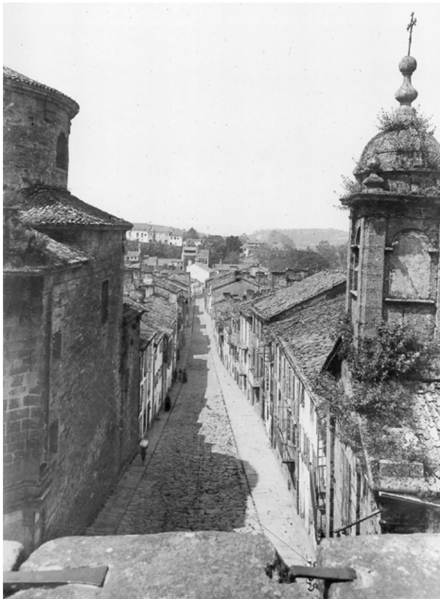
Fig. 1. Rúa das Hortas, Pelayo Mas, 1919. ADMIN_MEMORIASDECOMPOSTELA, “Rúa das Hortas [P. Mas, 1919]”, Memorias de Compostela , 2015 [na rede], disponible en < http://memoriasdecompostela.blogspot.com/2015/12/carretas-p-mas-1919.html > [Consulta: 22/06/2021].