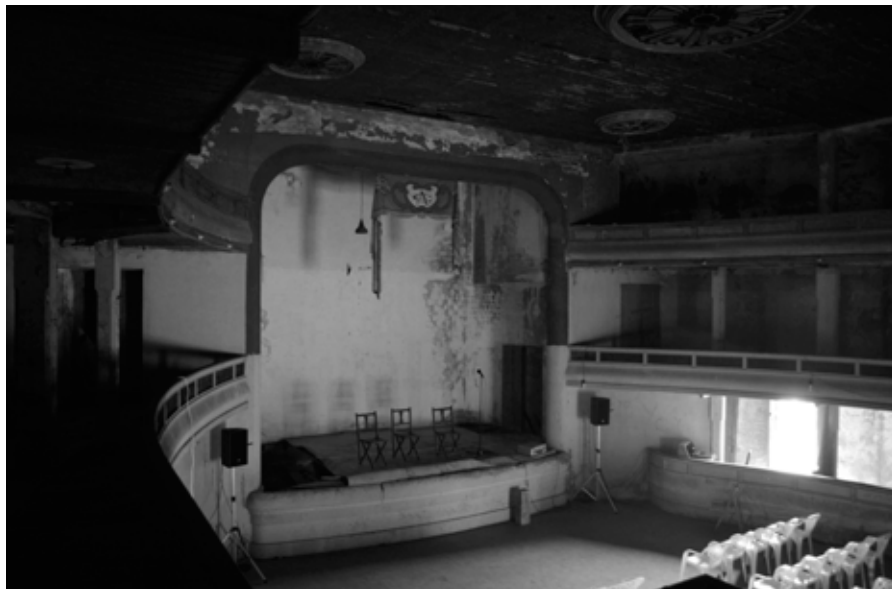
Fig. 7. Patio de butacas do Cine Adriano.