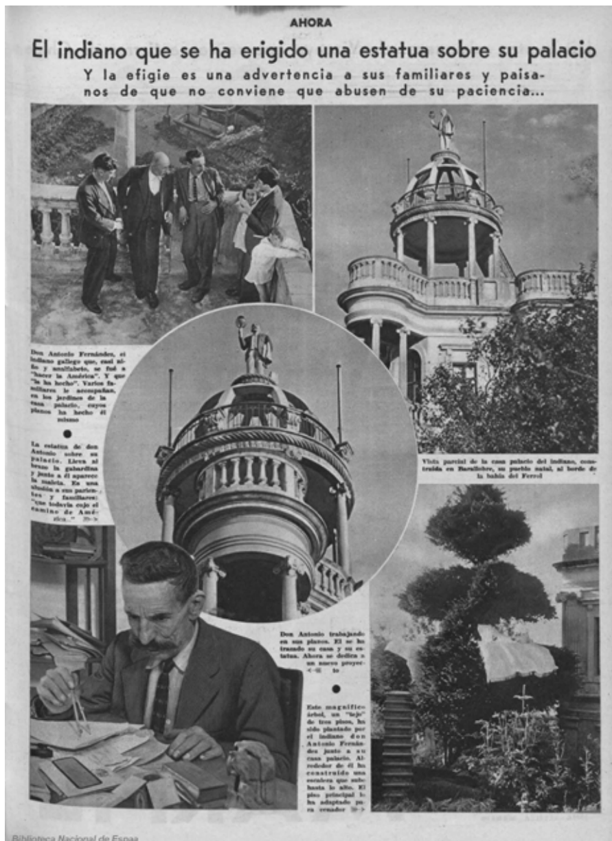
Fig. 5. Fragmento da entrevista “El hombre que se erigió así mismo una estatua de tamaño natural”, publicada no diario Ahora, polo periodista Lorenzo Carriba.