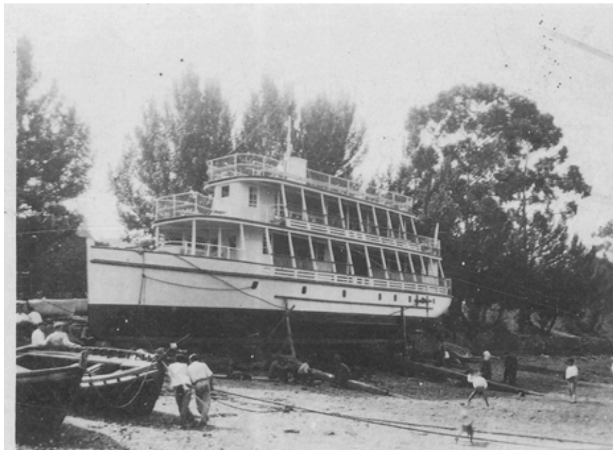
Fig. 2. A lancha Adriano II no estaleiro da ribeira de Maniños.

mesmo chegaron a rodarse algunhas escenas no Adriano II da película La Lola se va a lo Puertos , de 1947. Por todo isto, o Adriano III chegou a ser declarado Ben de Interese Cultural pola Junta de Andalucía no ano 2001 26 , recoñecendo tamén o valor dos seus predecesores.