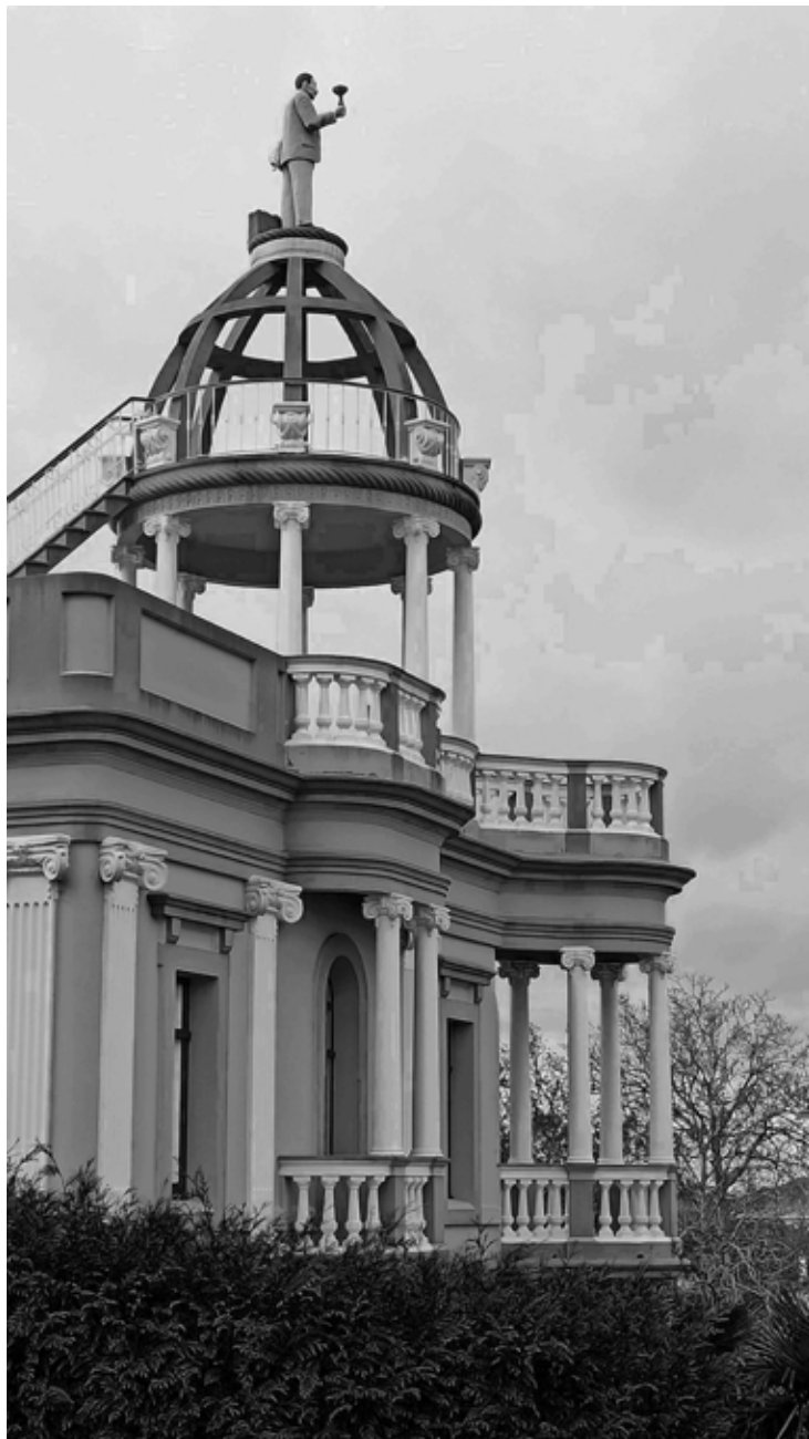
Fig. 3. Vista da cúpula da Casa da Maleta, coroada pola estatua de Antonio Fernández Fernández