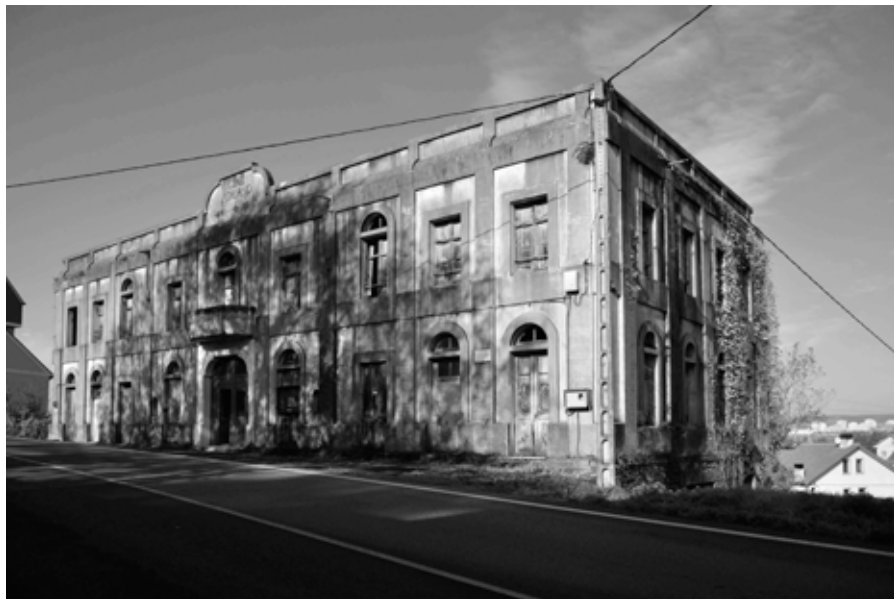
Fig. 6. Fachada principal do cine Adriano.

Todos los compatriotas suyos, que emigraron analfabetos al despuntar de la mocedad y regresaron después ricos al humilde rincón hogareño, han llevado a cabo obras filantrópicas, como construcción de hospitales, escuelas, bases de enseñanza agrícola o cualquier otra medida encaminada a elevar el nivel moral y cultural de sus convecinos. Don Antonio ha sabido cumplir también esa obligación, como lo prueban el teatro y la biblioteca de su pueblo natal; pero, además, ha sabido llevar a la práctica la idea más natural del mundo, a pesar de su aparente presuntuosidad: se ha hecho erigir una estatua a sí mismo. 48